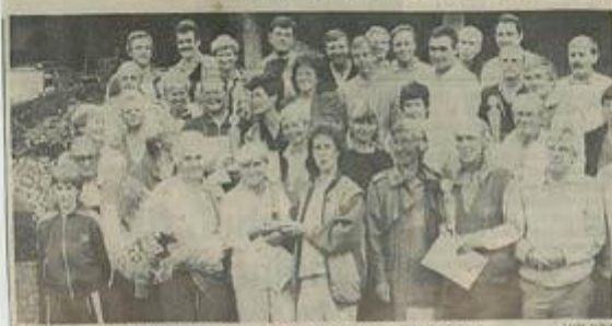
Gute Stimmung beim Senioren-Doppeltourier des Sunderner Tennisclubs.

Mixed: 1. Benzer/Benzer (TC Bigge-Olsberg), 2. Plass/Plass (TC BW Sundern), 3. Liefänder/Heintöhl und Busch/Kasche (beide TC Meschede).